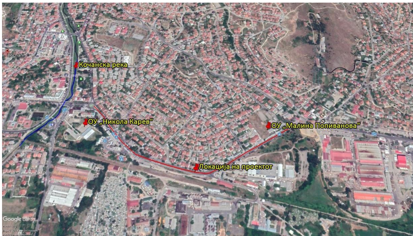
Слика 1 Локација на санацијата на улицата во Кочани

Проектот, каде што ќе се реализираат проектните активности за санација на улицата, се наоѓа во јужниот дел на Општина Кочани, поточно во градот Кочани. Планираните проектни активности ќе бидат изведени во три фази: подготвителни активности (обележување и расчистување на градилиштето - улица), санација на улицата (поставување асфалтен слој, итн.) и оперативна фаза - активности поврзани со редовни и превентивни одржување на соодветната улица. Вкупната должина на предметниот опфат ќе биде 955,39м. На Слика 1 е дадена локација на проектот и чувствителни рецептори во близина.