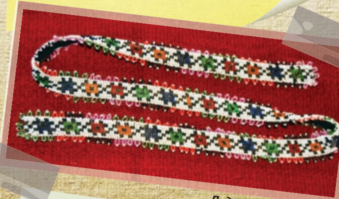
Подвеска од монистра

Според зачуваните преданија меѓу старо-седелците, областа многу настрадала за време на Карпошовото Востание. Голем дел од селата биле раселени во тој период. Како резултат на тоа во XVIII век следел бран на интензивно доселување од соседните области, а имало и внатрешни раселувања.