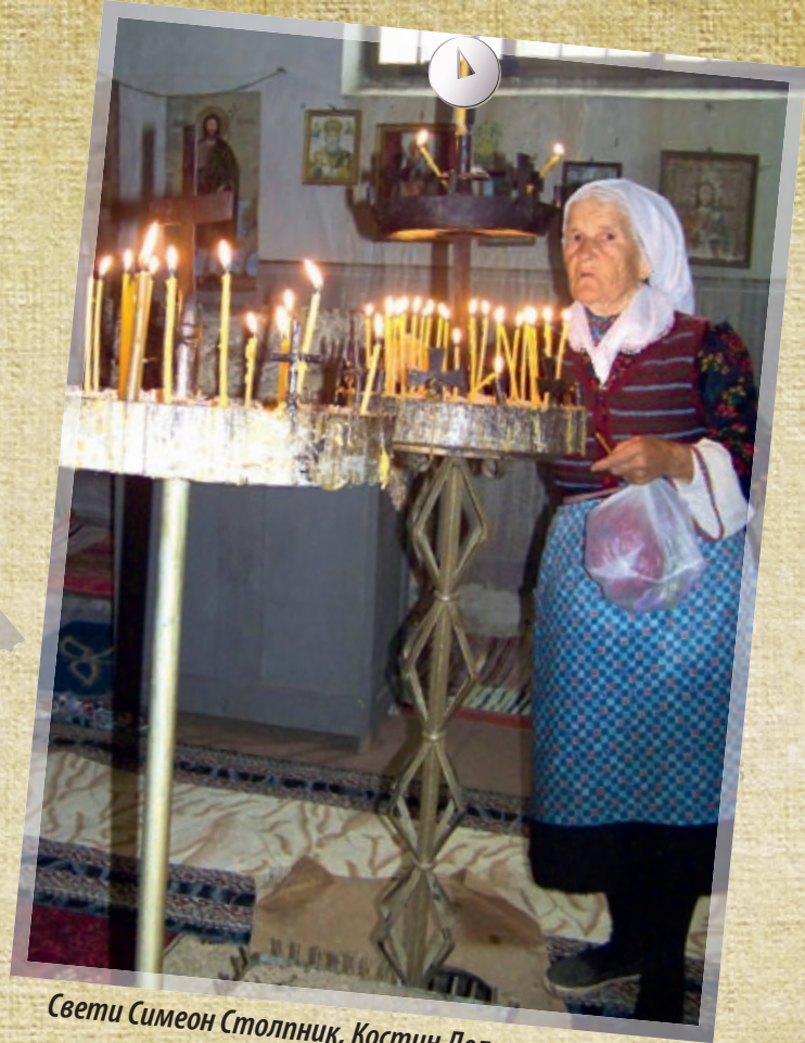
Свети Симеон Столпник, Костин Дол